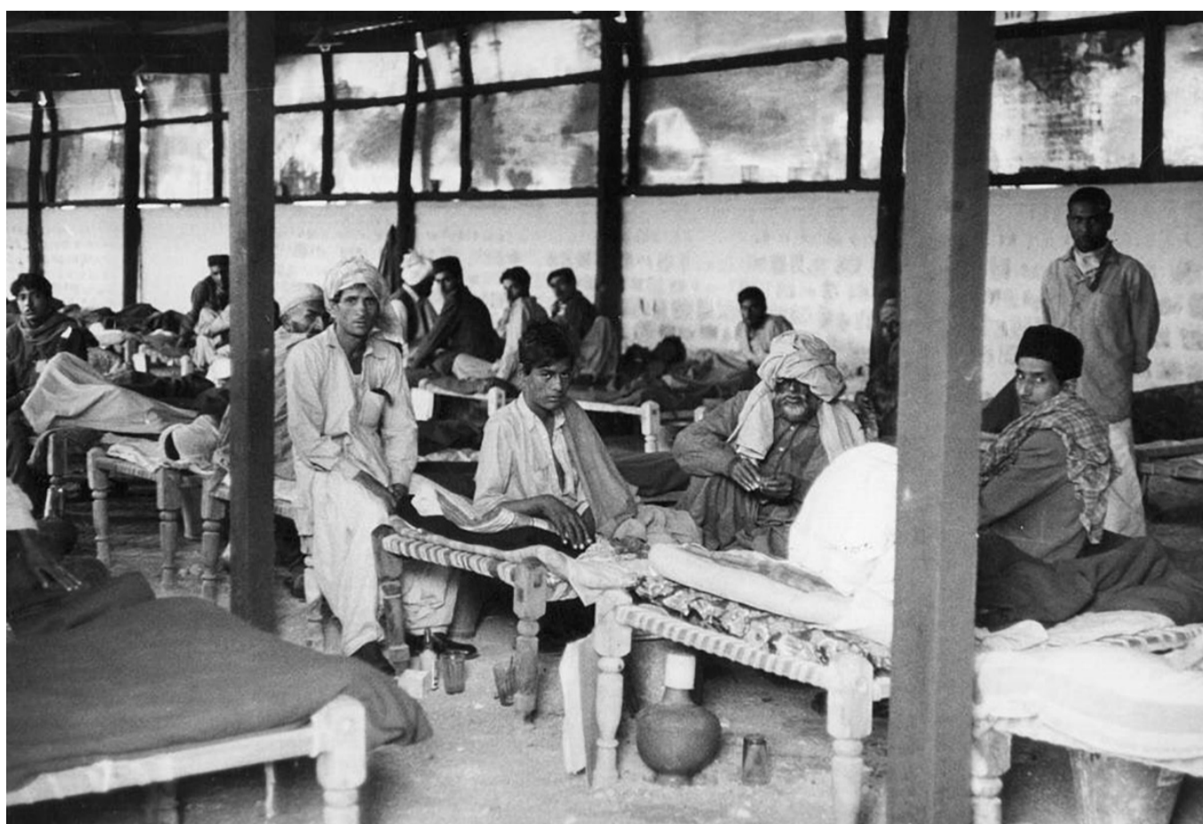
Госпиталь для больных оспой в Пакистане, 1962 год

Важную роль в успешной деятельности советских медиков на международной арене, в том числе и в эффективном участии нашей страны в деятельности ВОЗ сыграла активность заместителя Министра